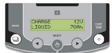
Intuitivt gränssnitt tillgänglig på 22 språk