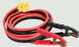
Klemmer: 2 x 8 m - 16 mm 2 056572